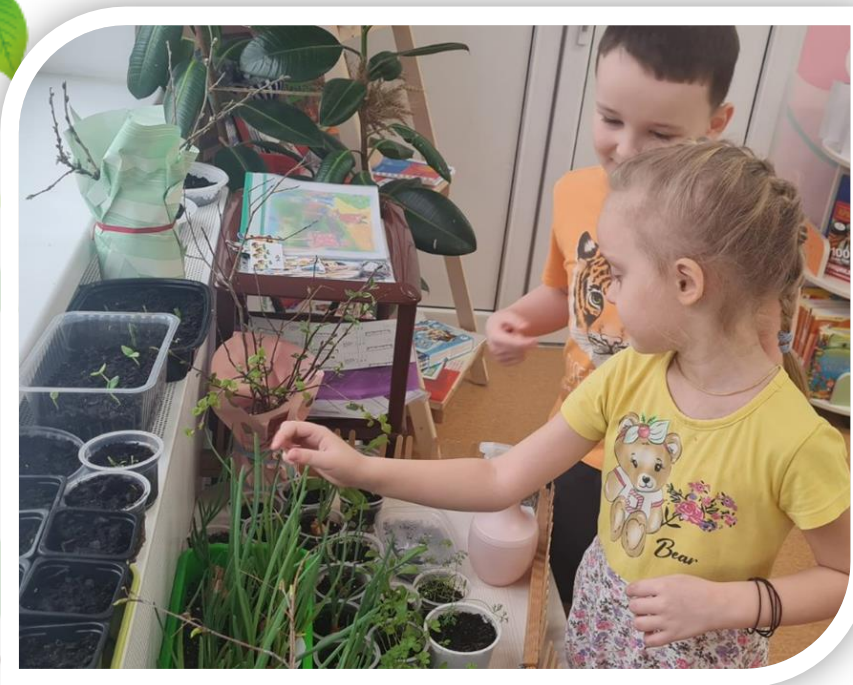
Наблюдение: проращивание лука. Полезьа зеленого лука