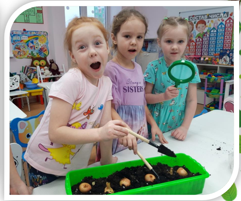
Уход за всходами: рыхление, полив.