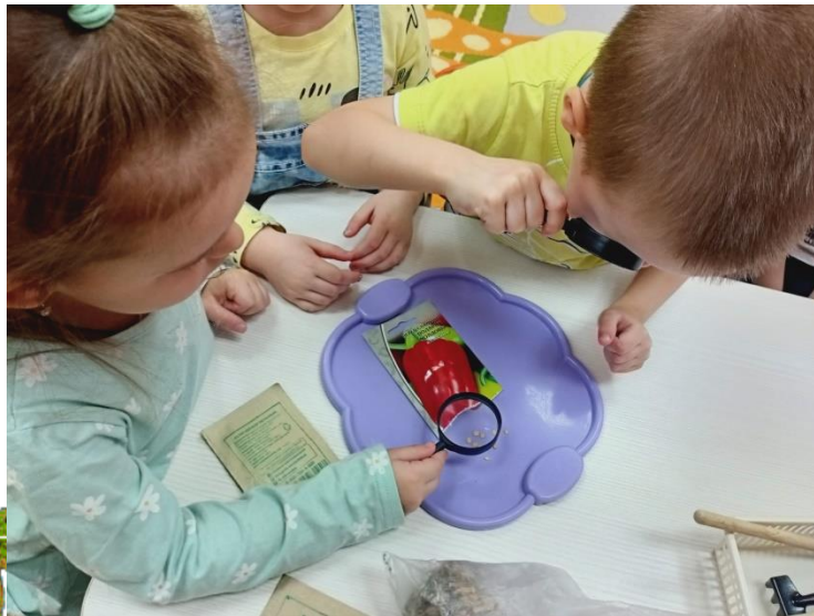
Знакомство с семенами перца