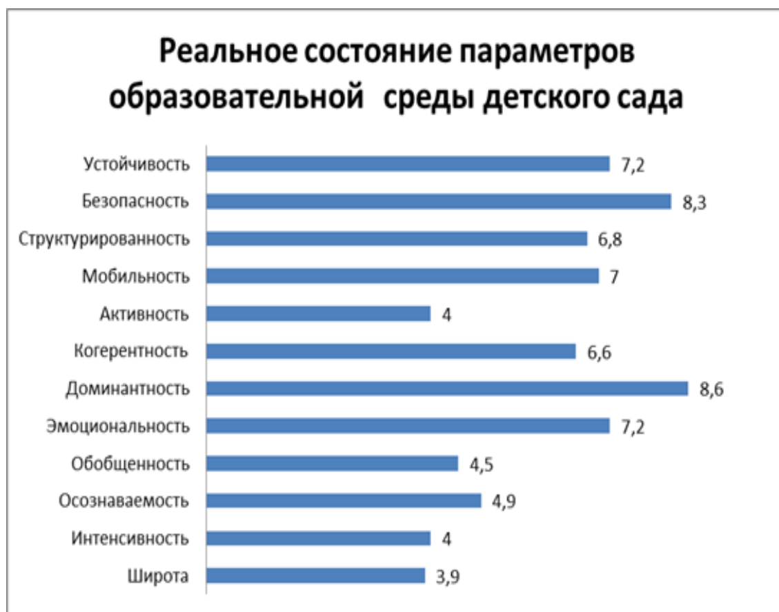
Рисунок 5. Результаты экспертного анализа системных параметров среды ДОУ

Наименее выражены: широта, интенсивность, активность