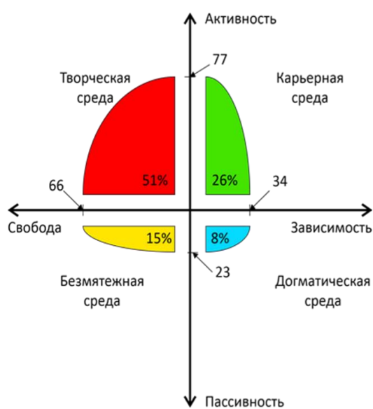
Рисунок 3. Оценка соотношения различных типов среды АДМИНИСТРАЦИЕЙ