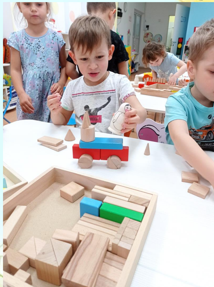
Конструирование «Машина для папы»