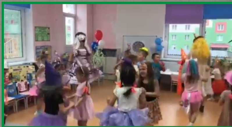
Исполнение зажигательного танца под песню «Человечки сундучные»