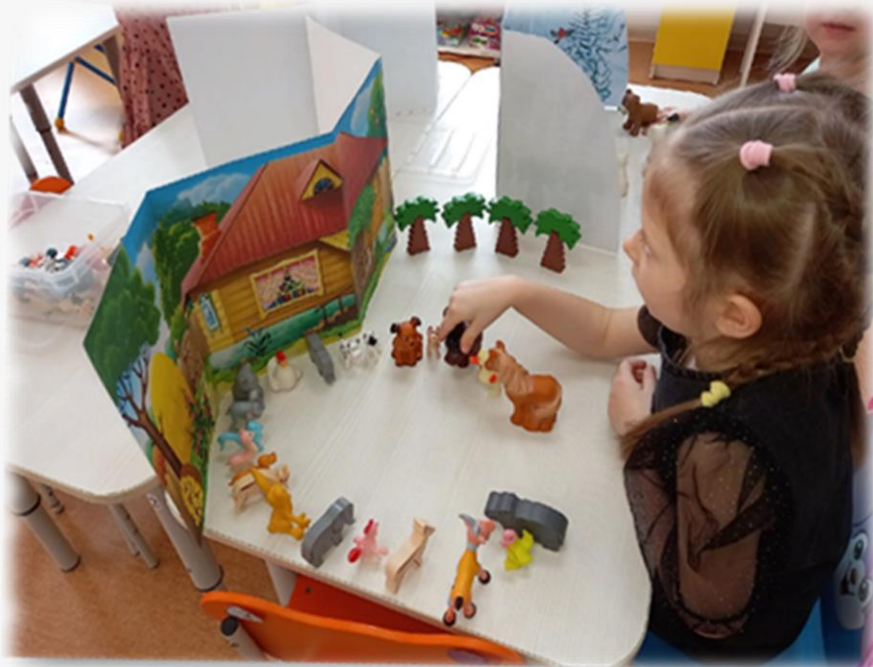
Макет «Зимний лес. Дикие животные»