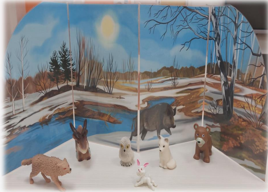
Макет «Весенний лес. Дикие животные»