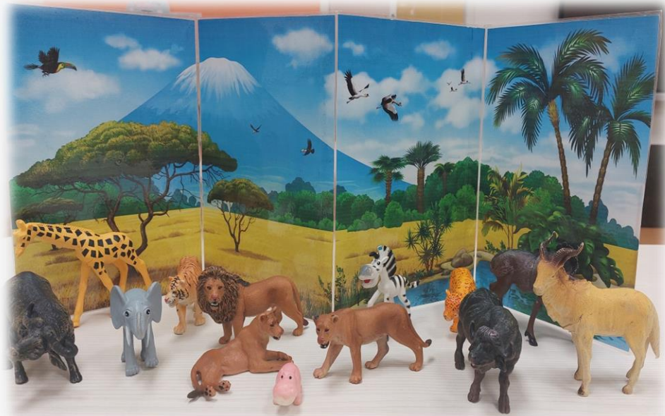
Макет «Африка. Дикие животные»