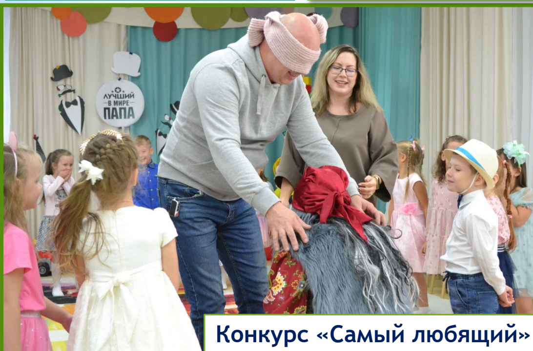
Конкурс «Самый любящий»